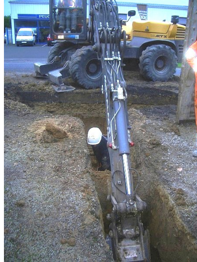
Quelques petites complications !