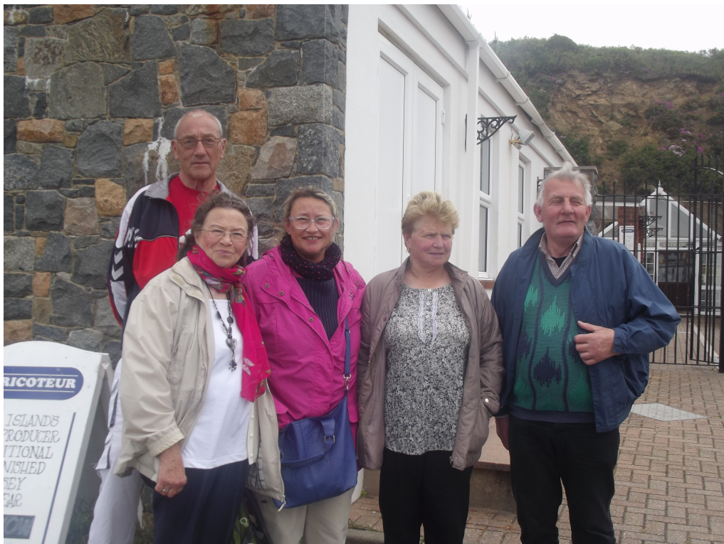
Quelques membres du club lors de notre sortie à Guernesey