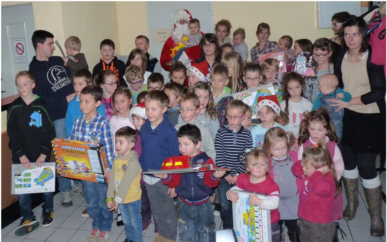
La photo souvenir

Ensuite, ce fut la photo souvenir avant le départ du Père Noël pour une autre destination.