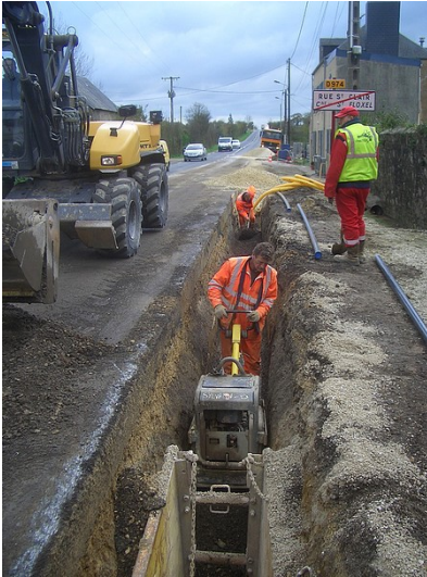
Les tranchées sont rebouchées au fur et à mesure